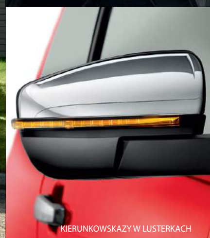
KIERUNKOWSKAZY W LUSTERKACH