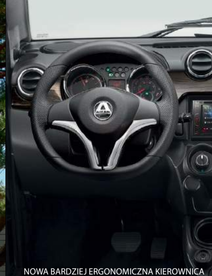
NOWA BARDZIEJ ERGONOMICZNA KIEROWNICA