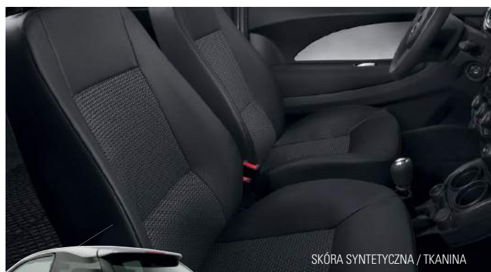
SKÓRA SYNTETYCZNA / TKANINA